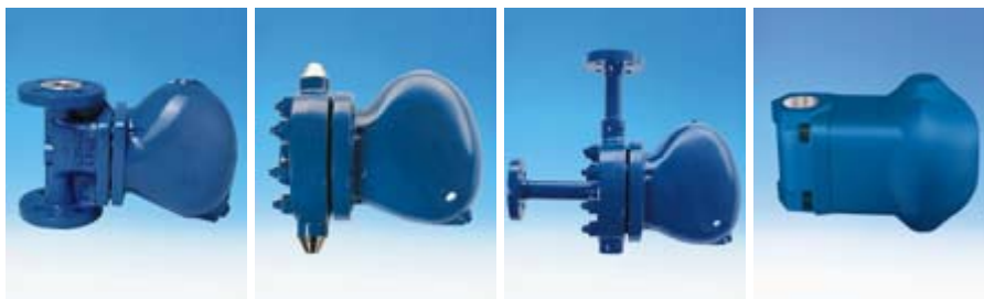
631-1,631ANSI-1 631-4,631ANSI-4 632-1,632ANSI-1 634-2,634ANSI-2